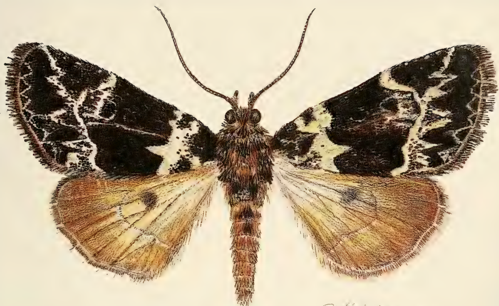
Abb. 4. Borbotana piskatschekae , spec. nov., Paratypus, Habitus.